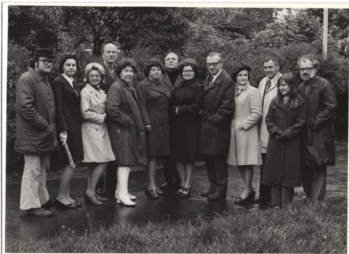
Foto pracovníků z Malé Plynárny (kolem roku 1970): pracovníci tehdejšího Ústavu krajinné ekologie – ÚKE ČSAV. Bohužel, většina z nich již nežije.