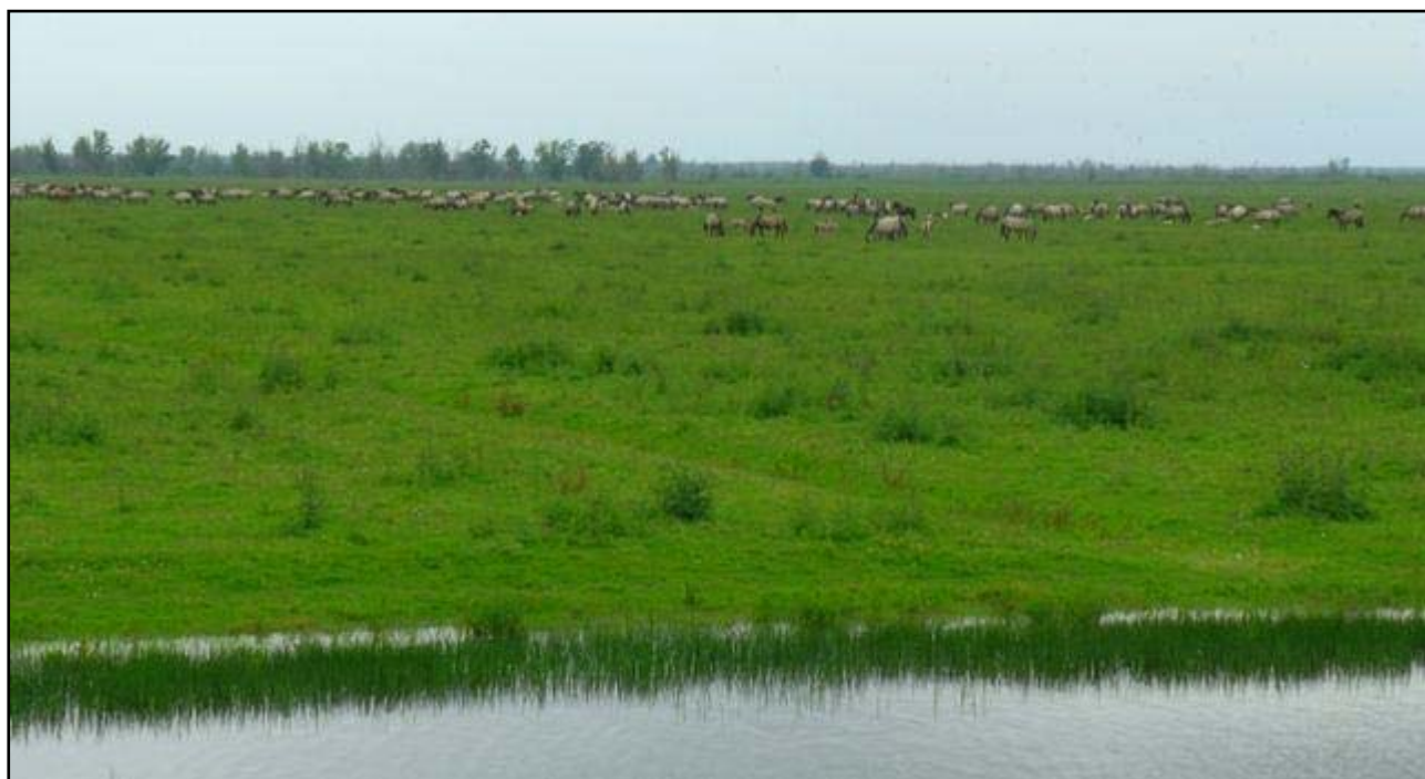
Část stáda koníků

Význam Oostvaardersplassen však není jen v bohatství avifauny. Rezervace byla po několik let spravována s cílem udržet a maximalizovat počty ptáků, což vedlo k některým nevídaným efektům (např. rozvoj botulismu v důsledku umělého ovlivňování vodní hladiny). Současně však vyšlo najevo, že ptáci sami významně mění své prostředí – zejména husy v důsledné honbě za kořínky rákosu vykouzly v dříve neprostupných houštinách jezírka a kanály, kde voda mohla volněji proudit. Tato pozorování vedla k myšlence podpořit rozvoj ekosystému, který by se (jak je to u přirozených ekosystémů běžné) udržoval sám. O vegetaci mokřin a jezer se postarali vodní ptáci, co však s okrajovou sušší zónou, jež rychle zarůstala vrbami?