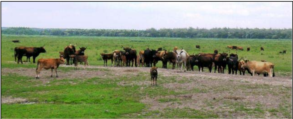
Stádo Heck dobytka (© K.K.)

Řešení bylo nalezeno v podobě velkých býložravců. V roce 1983 zde bylo vysazeno 32 turů, tzv. „Heck cattle“, a o rok později dvacetihlavé stádo polského konika. Oba druhy se vybíraly s ohledem na jejich odolnost a přírodní charakter. „Heck“ dobytek je výsledkem pokusu o regeneraci evropského pratura a polští konici jsou nejbližším příbuzným původního evropského divokého koně tarpana. Tato zvířata žijí v rezervaci zcela volně a dnes dosahují počtů několika set kusů, to samé platí o později introdukovaném druhu – jelenu evropském. Velcí býložravci se coby chybějící článek v potravní pyramidě zcela osvědčili, ale funkci vrcholového predátora (jenž zde z pochopitelných důvodů chybí) musí převzít člověk. Jedinou intervencí do života zde žijících koní, turů i jelenů je tedy jednorázová selekce koncem zimy.