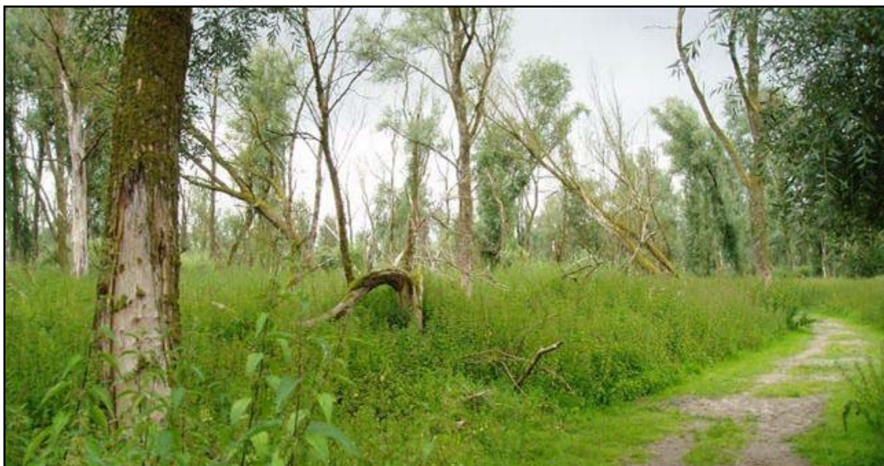
Okrajová zóna s vrbovým luhem

Význam Oostvaardersplassen však není jen v bohatství avifauny. Rezervace byla po několik let spravována s cílem udržet a maximalizovat počty ptáků, což vedlo k některým nevídaným efektům (např. rozvoj botulismu v důsledku umělého ovlivňování vodní hladiny). Současně však vyšlo najevo, že ptáci sami významně mění své prostředí – zejména husy v důsledné honbě za kořínky rákosu vykouzly v dříve neprostupných houštinách jezírka a kanály, kde voda mohla volněji proudit. Tato pozorování vedla k myšlence podpořit rozvoj ekosystému, který by se (jak je to u přirozených ekosystémů běžné) udržoval sám. O vegetaci mokřin a jezer se postarali vodní ptáci, co však s okrajovou sušší zónou, jež rychle zarůstala vrbami?