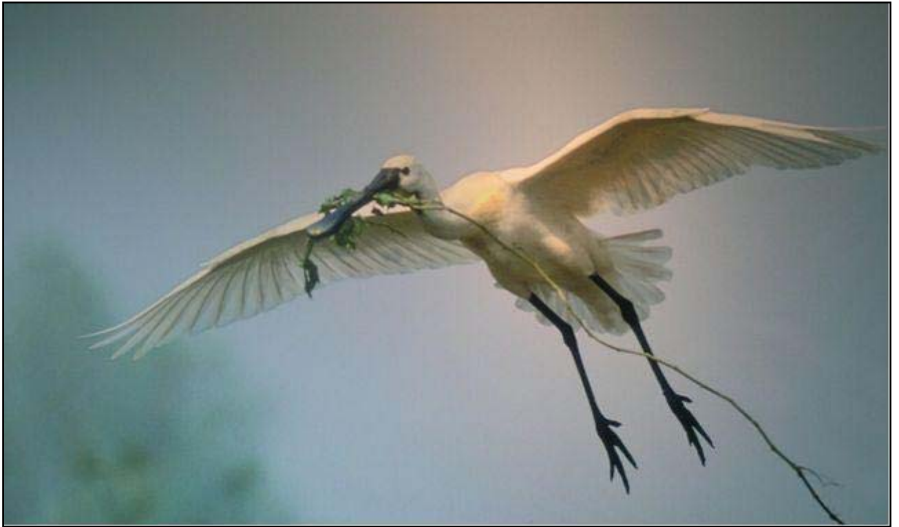
Kolpík bílý

Z toho důvodu je těžké určit, jaký bude charakter rezervace za dalších dvacet let. Zde není vypracována představa nějaké „cílové“ krajiny či ekosystému, cílem je samotný proces a poznávání jeho zákonitostí. Uvažuje se proto o propojení rezervace s lesním komplexem na východě, jenž by měl sloužit jako zimní úkryt pro zvěř, popřípadě s národním parkem Veluwe, což by mělo umožnit další migraci a omezit zimní úmrtnost zvířat.