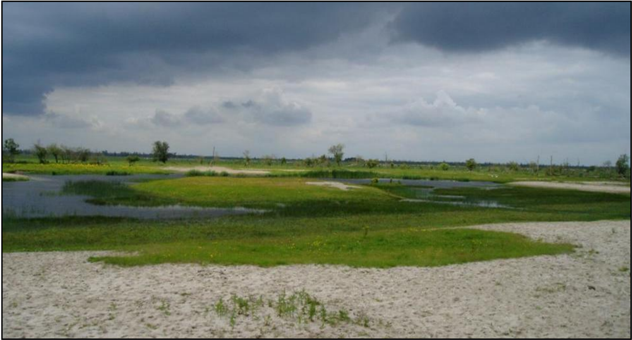
Váté písky v sušší části rezervace

Rezervaci Oostvaardersplassen lze najít cca 50 km východně od Amsterdamu na poldru Flevoland, jenž byl vytvořen přehrazením a vysušením části Markermeer v r. 1968. Většina Flevolandu je zemědělsky využívána, kromě roztroušeného osídlení se při hrázi oddělující poldr od zbytku Markermeer nacházejí také dvě prosperující města – Almere a Lelystad. Přímo mezi nimi leží území o rozloze cca 5,5 km 2 (s „nadmořskou výškou“ cca -4 m), jež bylo původně určeno pro výstavbu průmyslové zóny. Krize v 70. letech však tento záměr odsunula na neurčito a svojí šance se chopila příroda. Laguny a mokřady zarůstající pionýrskou vegetací začali využívat vodní ptáci, zejména husy velké jako zastávku na tahu. Později se přidali též kormoráni a kolpíci a mnozí další kteří zde našli ideální podmínky ke hnízdění. V současné době, zejména v letních měsících, oblast hostí něco kolem 250 druhů ptactva včetně orla mořského.