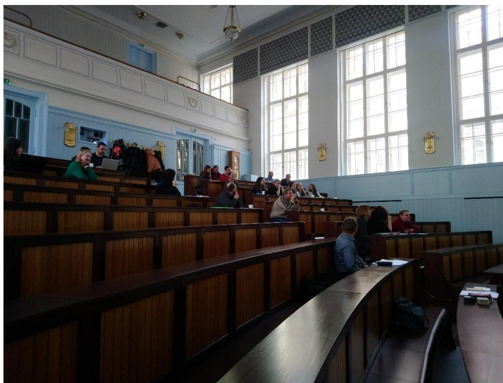
Výroční konference IALE-CZ, která se konala 7. 2. 2023 na Albertově